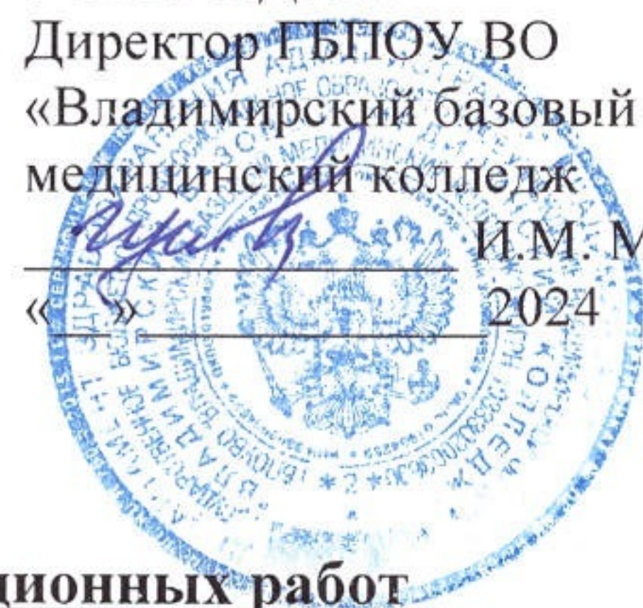
График защиты выпускных квалификационных работ студентов очно – заочного отделения 02а, 02б, 02в, 02г групп Специальность 34.02.01. Сестринское дело, апрель 2024 года (80 чел.)