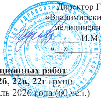
График защиты выпускных квалификационных работ студентов очно – заочного отделения 22а, 22б, 22в, 22г групп Специальность 34.02.01. Сестринское дело, апрель 2026 года (60 чел.)